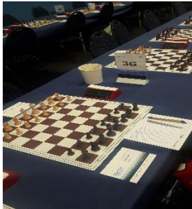
Dit was mijn groep waarin ik speelde

In januari doe ik de laatste jaren steeds mee aan het schaaktoernooi in Wijk aan Zee. 2020 was hierop geen uitzondering. Samen met mijn vriendin en dochter hadden we een mooi onderkomen geregeld om een paar mogen dagen te hebben in de Noord-Hollandse badplaats. In het eerste weekend worden altijd de weekendvierkampen-toernooi gehouden. Je speelt 3 partijen tegen gelijkwaardige tegenstanders. Ik werd ingedeeld in groep 3G en kreeg 2 keer wit en 1 keer zwart.