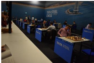
Samen in 1 grote zaal met de grootmeesters

Door deze resultaten had ik 2 punten uit 3 partijen gescoord en dat eindigde ik op een 2 de plaats. Als beloning mocht ik een mooi schaakboek uitzoeken. Tot volgend jaar!! Tot slot nog een paar mooie foto's, want ik was niet alleen deelnemer, maar ook schaakliefhebber.