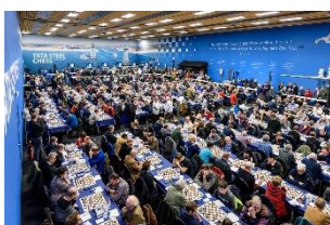
Het blijft een indrukwekkend geheel zoveel schakers bij elkaar.